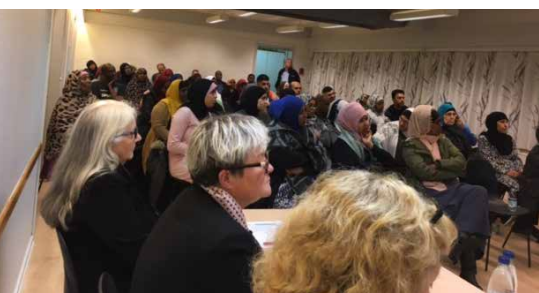
Mange beboere mødte op for at høre om deres pligter og rettigheder.

"Det er ikke udelukkende en forældreopgave, men også en onkel-